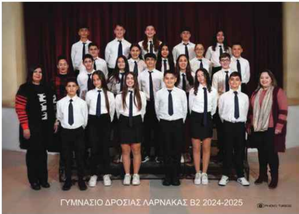
ΓΥΜΝΑΣΙΟ ΔΡΟΣΙΑΣ ΛΑΡΝΑΚΑΣ Β2 2024-2025