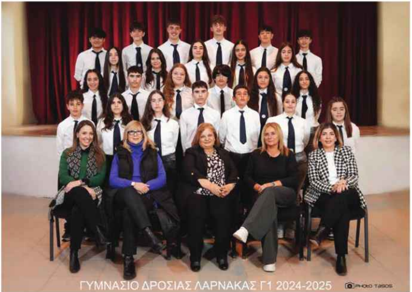
ΓΥΜΝΑΣΙΟ ΔΡΟΣΙΑΣ ΛΑΡΝΑΚΑΣ Γ1 2024-2025