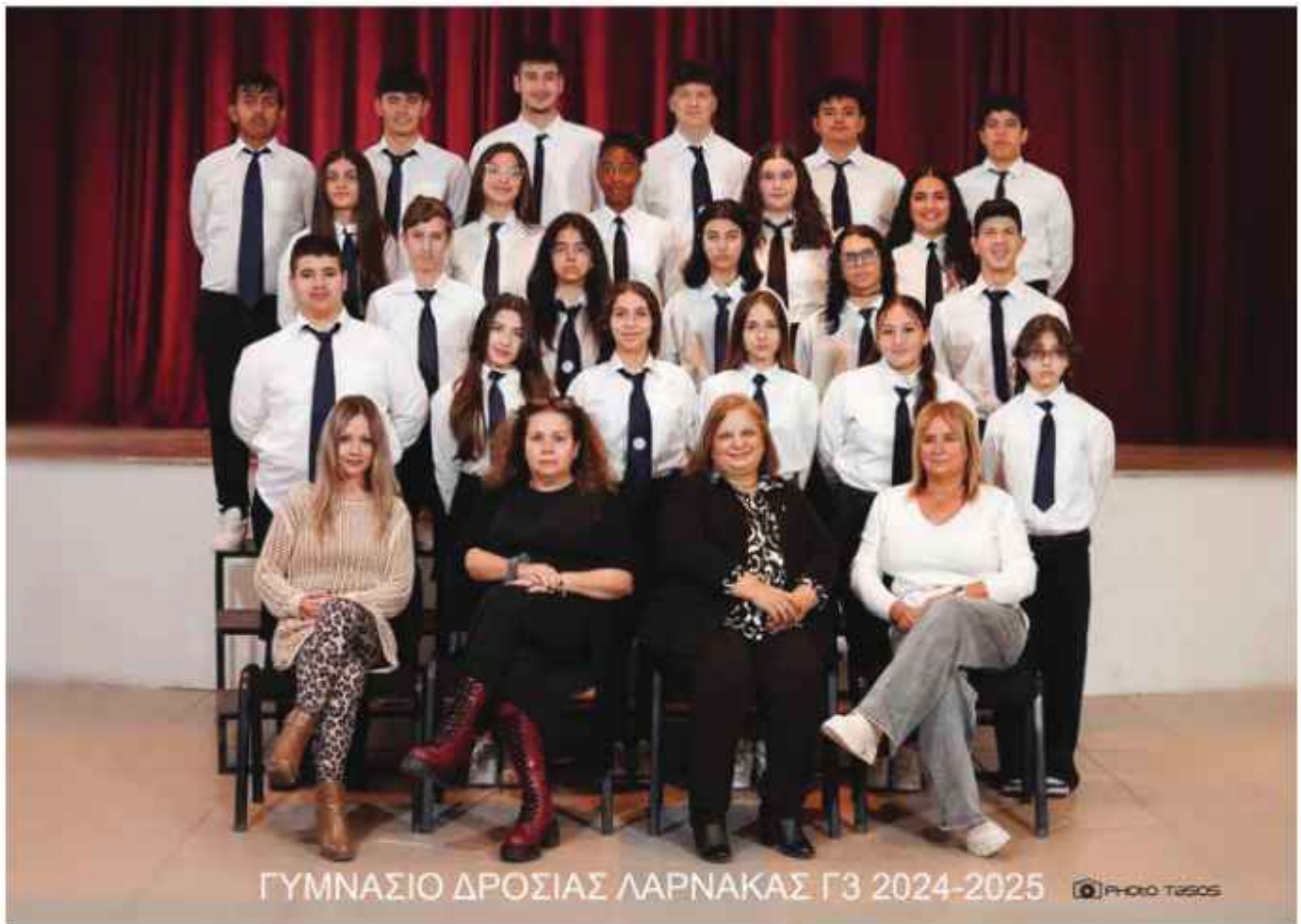
ΓΥΜΝΑΣΙΟ ΔΡΟΣΙΑΣ ΛΑΡΝΑΚΑΣ Γ3 2024-2025