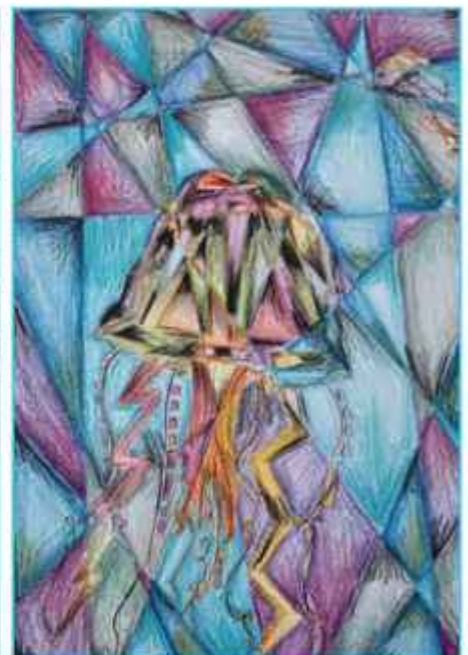
Αντριάννα Ιωάννου Γ4