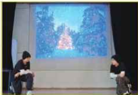
Έλενα Καπετάνιου Α3 Αλεξάνδρα Ρολάνδου Α2