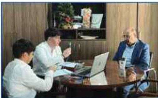
Συνέντευξη με τον δήμαρχο Λάρνακας κ. Ανδρέα Βύρα