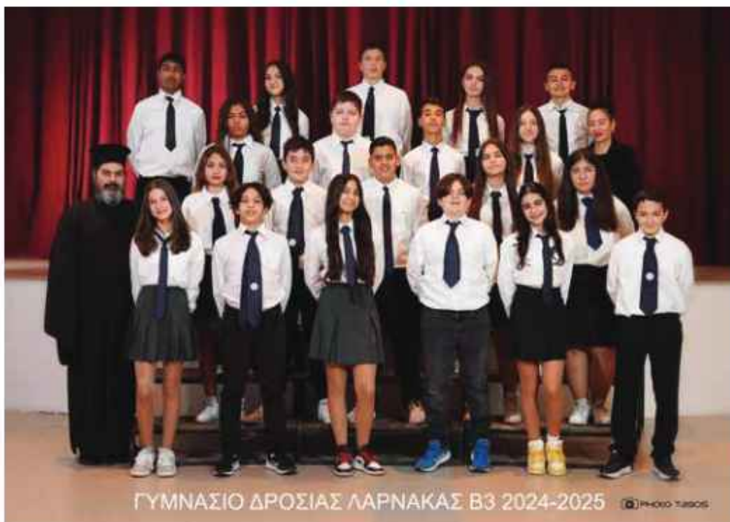
ΓΥΜΝΑΣΙΟ ΔΡΟΣΙΑΣ ΛΑΡΝΑΚΑΣ Β3 2024-2025