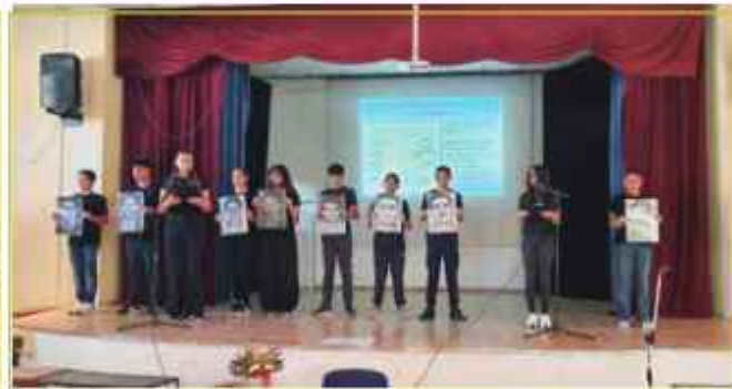
Παρουσίαση: Οι 9 απαγχονισθέντες ήρωες της ΕΟΚΑ