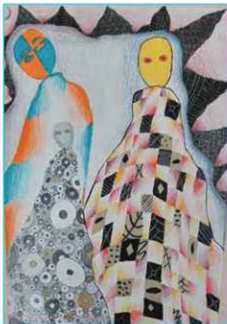
Αικατερίνη Φρούσιου Γ5