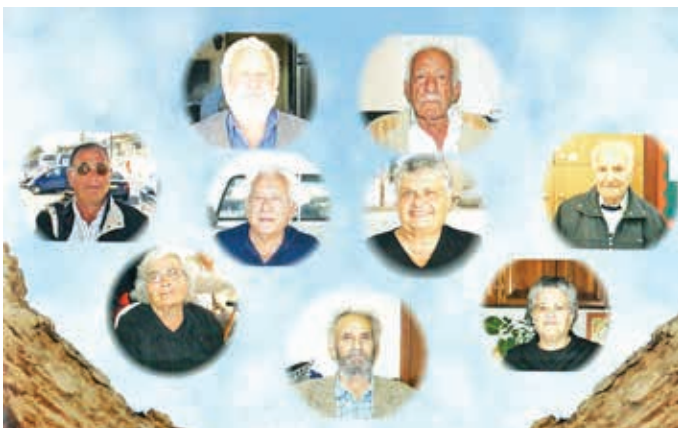
Εγκλωβισμένοι από το 1974...