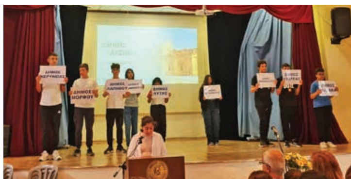
Β5 Κατεχόμενοι Δήμοι