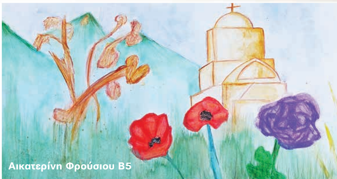
Αικατερίνη Φρούσιου Β5

Και όσοι εγκλωβισμένοι μένουνε στο όμορφο χωριό έχουν ψυχή αγέρωχη αίμα ελληνικό και πίστη στον Πανάγαθο Θεό.