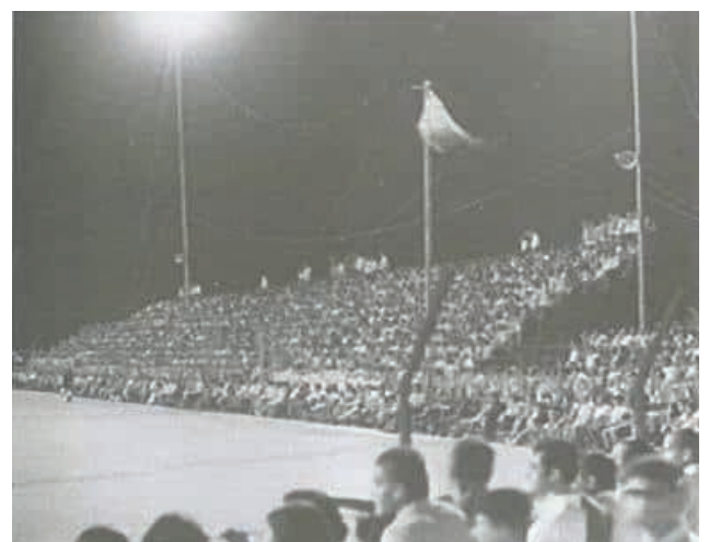
Στάδιο ΑΣΥΛ ΛΥΣΗΣ - Γρηγόρη Αυξεντίου πριν το 1974