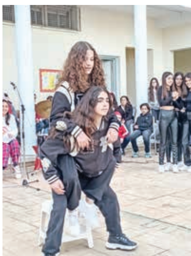
Θέα Ιακώβου Α3 Δέσποινα Θεμιστοκλέους Α3