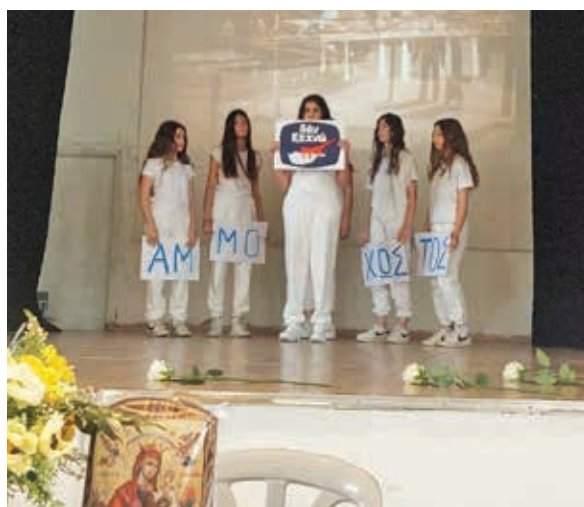
Β2 Χορογραφία Αμμοχώστου

Ευχαριστούμε θερμά την κ. Χαρίτα Μάντολες, τον κ. Μιχάλη Μικέλλη, τον κ. Μιχάλη Τζιώρτα και τον κ. Χαράλαμπο Χαράλαμπους που μεταλαμπάδευσαν στα παιδιά «ιστορίες ζωής».