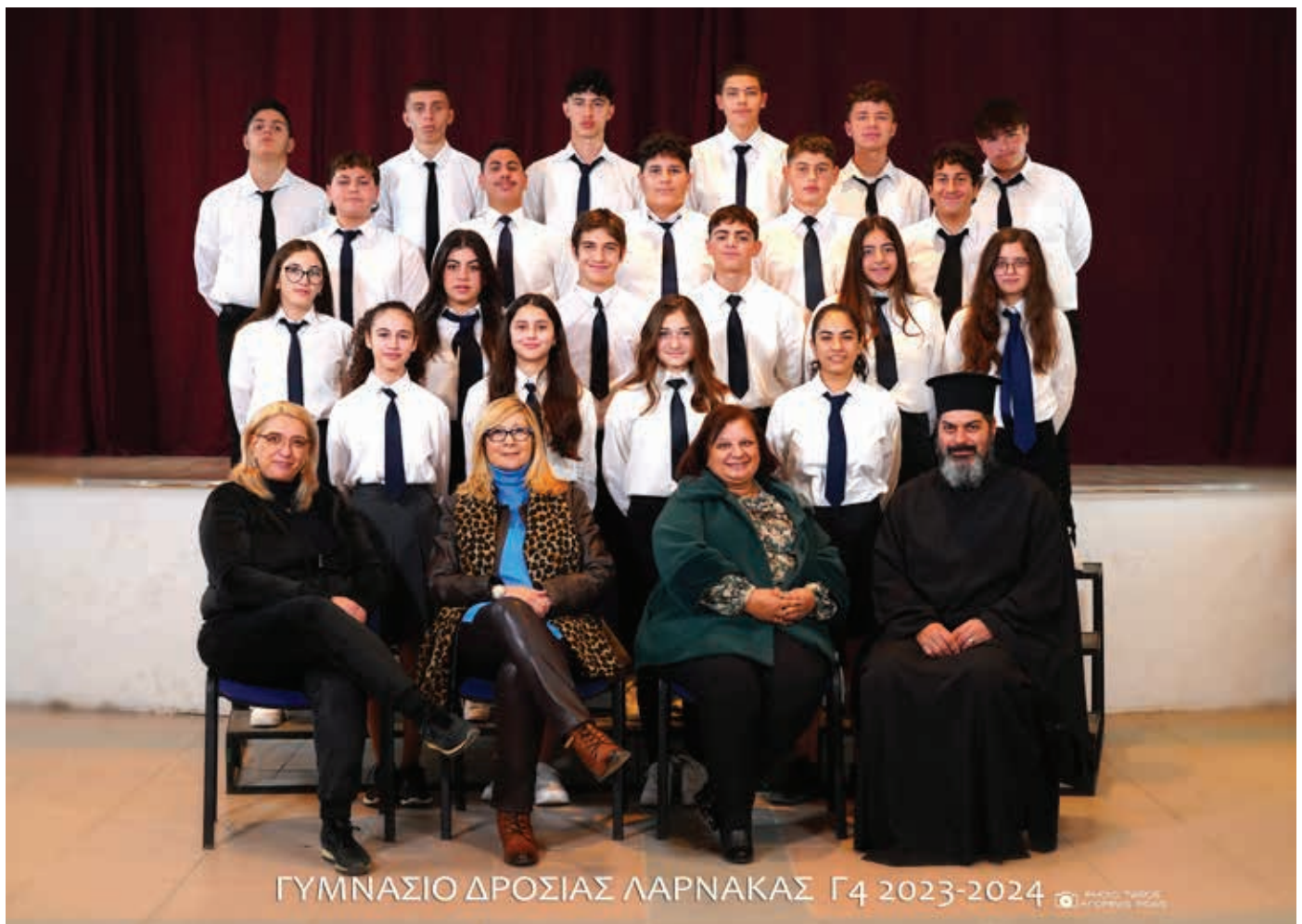
ΓΥΜΝΑΣΙΟ ΔΡΟΣΙΑΣ ΛΑΡΝΑΚΑΣ Γ4 2023-2024