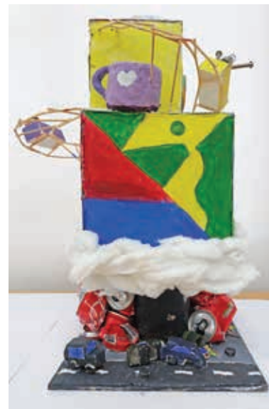
Κωνσταντίνα Λοιζου Β4