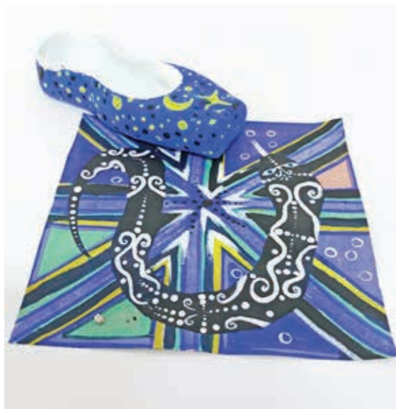
Εύα Ζαχάροβα Β4