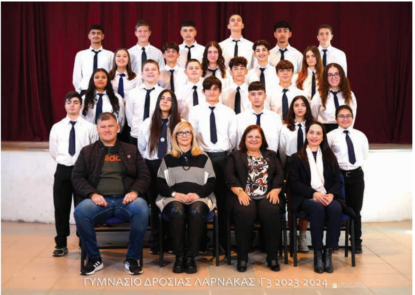
ΓΥΜΝΑΣΙΟ ΔΡΟΣΙΑΣ ΛΑΡΝΑΚΑΣ Γ3 2023-2024