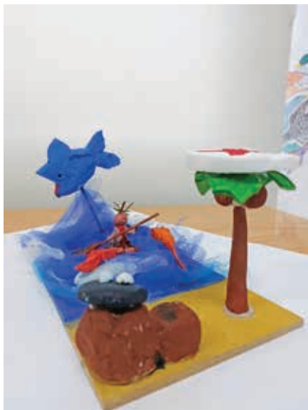
Δέσποινα Κρόκου Β4